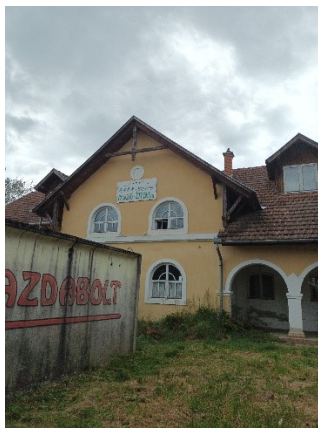
NÉGY FENYŐ Panzió és Étterem => NEM üzemel!!!