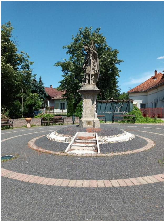
SZENT FLÓRIÁN szobra

körbe a talapzaton ez a könyörgés található: