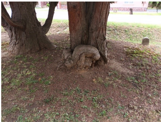
NE ijedj meg! NEM koldus! ☺ ... csak a tuja gyökere!!