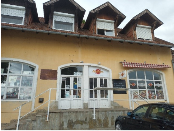
HUSIKÁM delikátesz és falatozó