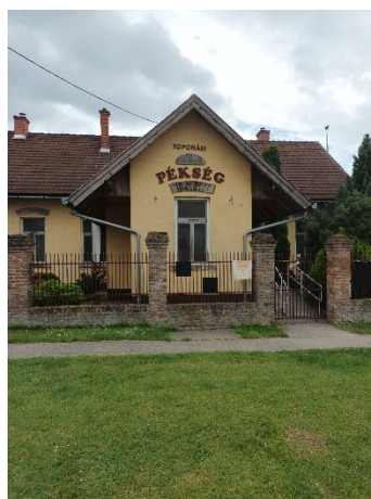
Desedai Pékség és Cukrászüzem

.... érdekességek, ha nappal végig mész Toponár utcáin.